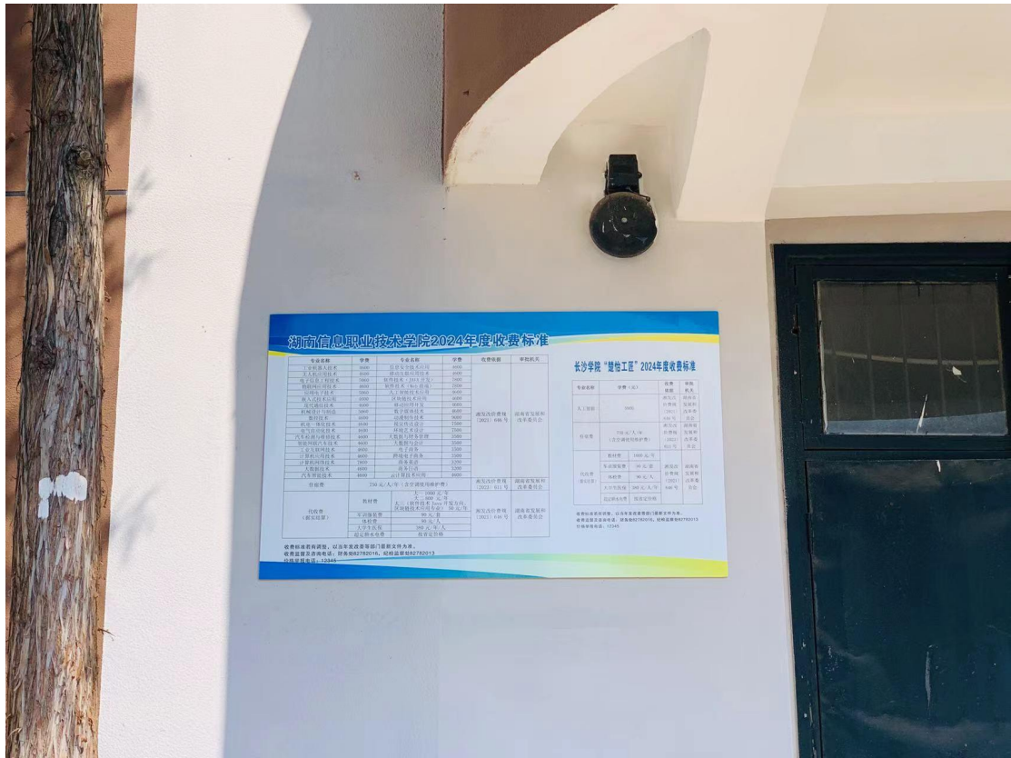
湖南信息职业技术学院南校区 29 号楼