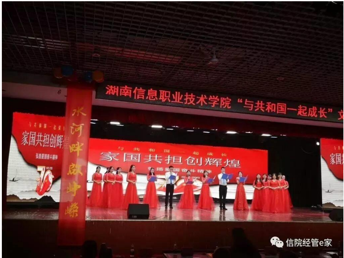
3、“筑梦”颁奖晚会精彩纷呈